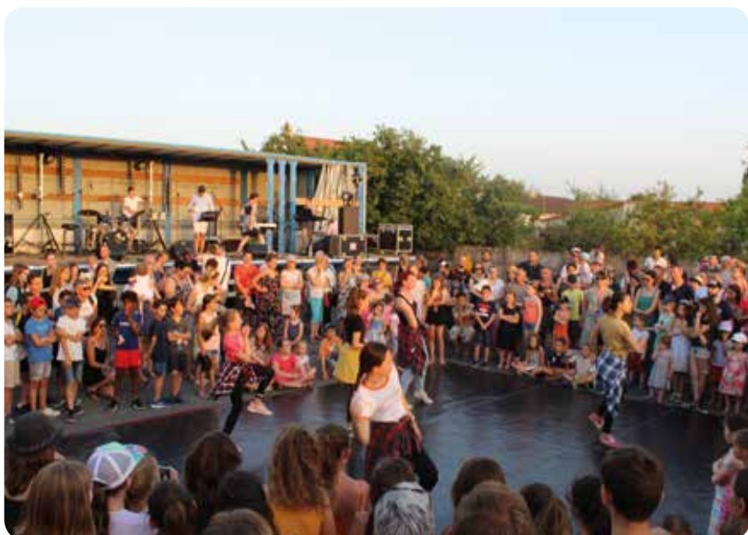
La fabrique de la danse montre ses futurs talents