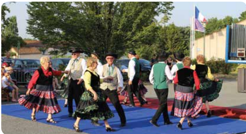
La farandole des 3 Provinces a toujours envie de tourner...