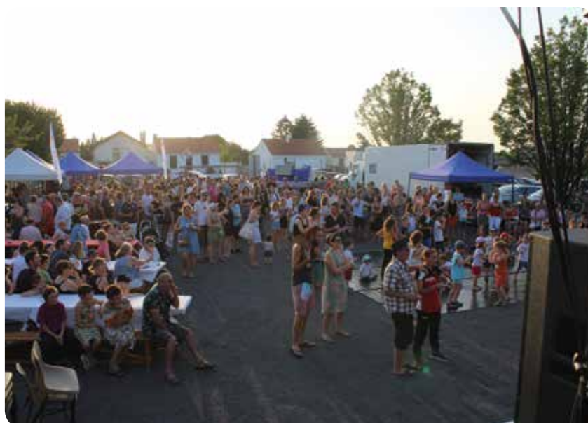
Le public cugandais était au rendez-vous