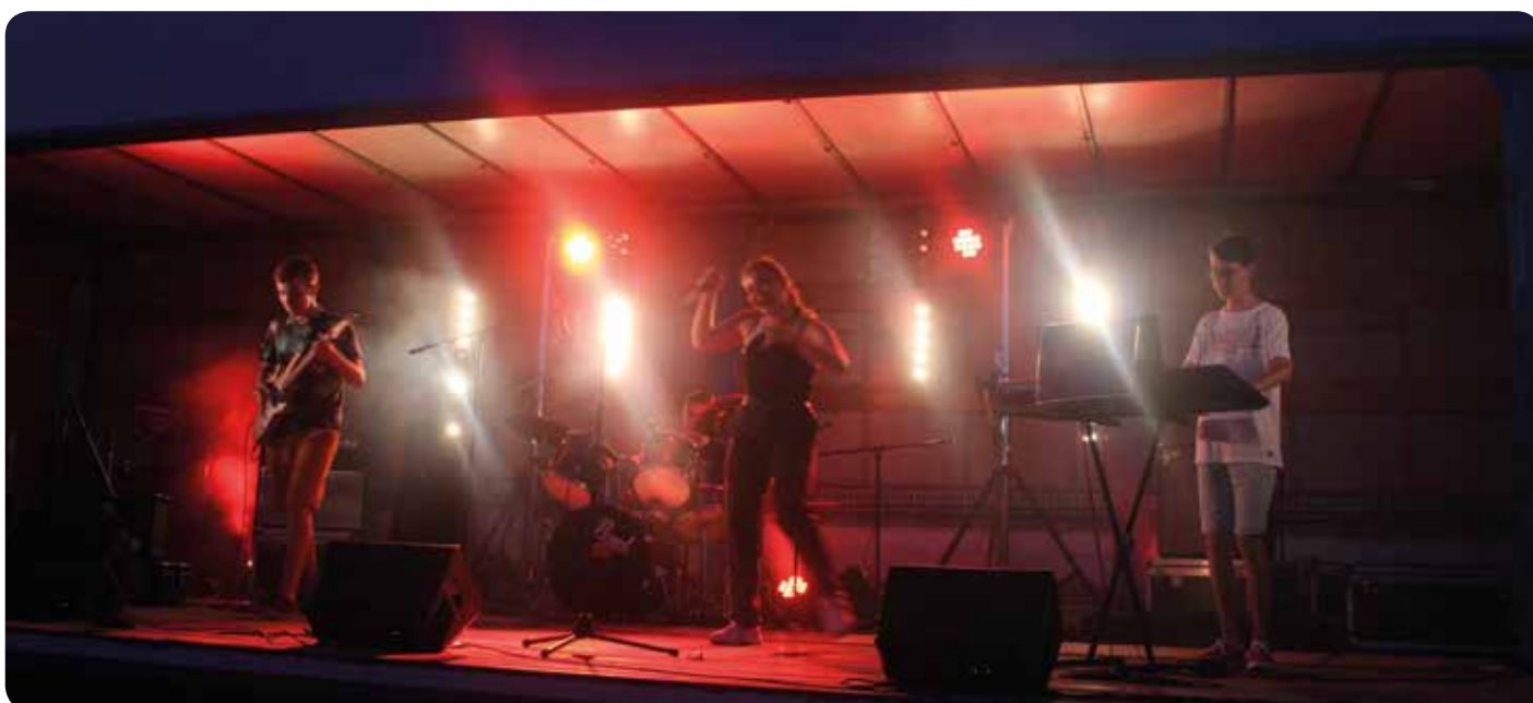
Les jeunes étudiants du groupe Seeds