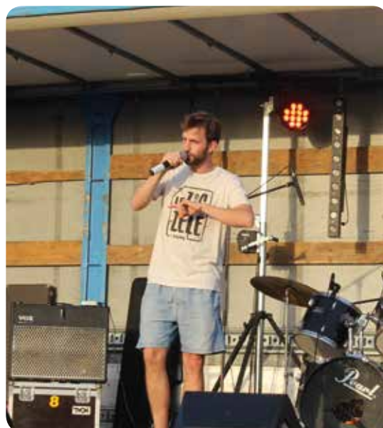
Le Zig Zélé, un pro du hip-hop