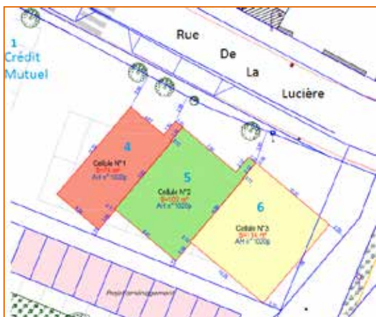
Localisation des cellules commerciales

L'emprise foncière propriété de la commune correspondant à la surface des bâtiments est vendue au prix de 70€ HT/M 2 . Reproduisant le modèle déjà expérimenté pour la maison de santé « les Caducées », la pharmacie et le Crédit Mutuel, les aménagements extérieurs sont réalisés par la commune.