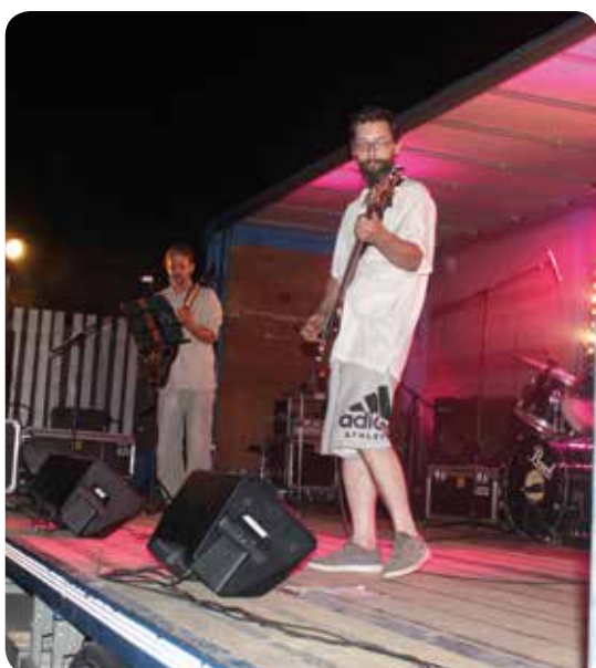
Le groupe « Mam out at Home » sur scène