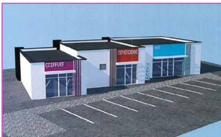
Perspective des bâtiments