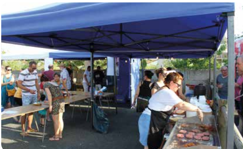
L'UDEC assure la restauration et le bar