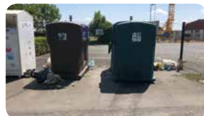
Containers du complexe sportif le 13 juillet !!!

Nous en appelons à la responsabilité des « délinquants occasionnels », qu'ils se posent la question sur le plaisir des yeux face à de tels agissements !