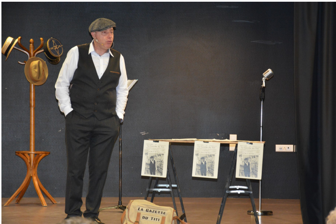
Goûter de la Chandeleur édition 2019, voir en dernière page

BULLETIN D'INFORMATIONS DE LA BERNARDIÈRE