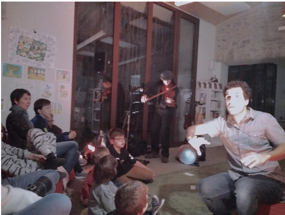
La Nuit de la lecture à la Médiathèque, voir en dernière page

BULLETIN D'INFORMATIONS DE LA BERNARDIÈRE